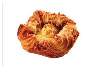
Suggerimento di presentazione

Ingredienti: acqua, farina di FRUMENTO tipo "1", olio di colza, zucchero, olio di cocco, olio di colza idrogenato, zucchero di canna, NOCCIOLE tritate 3,2%, lievito, amido modificato, affermissant (isomalto), sale, sciroppo di glucosio disidratato, emulsionanti (mono- e digliceridi degli acidi grassi, esteri mono- e diacetiltartarici di mono- e digliceridi degli acidi grassi), stabilizzanti (pectine, gomma di guar, alginato di calcio, difosfati, fosfati di sodio), sciroppo di glucosio, aceto, coloranti (carbonato di calcio, caroteni), sciroppo di zucchero invertito, aroma natural (sabor de baunilha), farina d' ORZO maltato, farina di SEGALE , acidificante (acido lattico), antiagglomerante (carbonato di calcio), proteine di piselli, gelificanti (agar-agar), melasso, aroma naturale, agente di trattamento della farina (acido ascorbico), Correttori di acidità (acido citrico, carbonati di sodio, acido cloridrico).